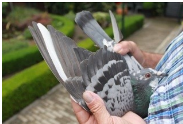
B-10-6197261 "Sproetje", wylatała m. in. 1., 1., 2., 5., 5., 6. 7. 8., 8., 8., 8., konkurs (bez powielania!), kandydatka na Olimpiadę 2013?