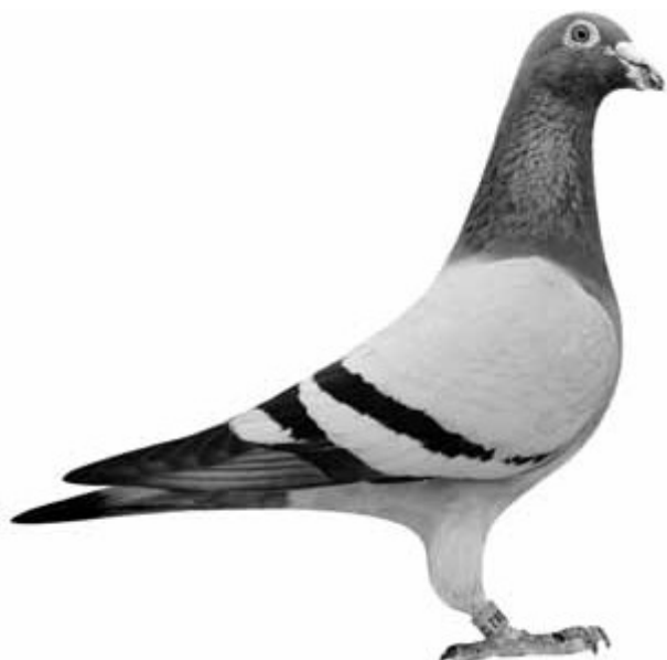
„Blieskske” B-05-3006882 . Wnuk „Bliksem „ x