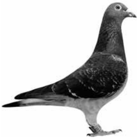
"Comijntje" B-05-3176531. 1 z Tours'07 na 2.267 gołębi. 1 z Poitiers'08 na 1.687 gołębi. 2 prowincjonalny as KBDB w 2005r.