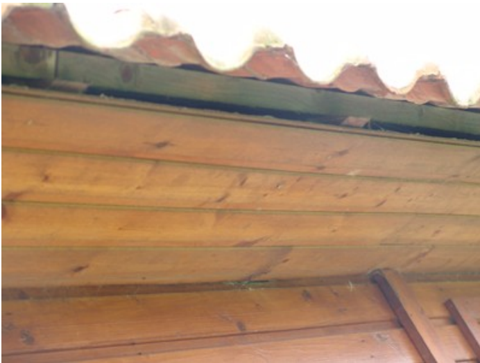
Oto ta szczelina