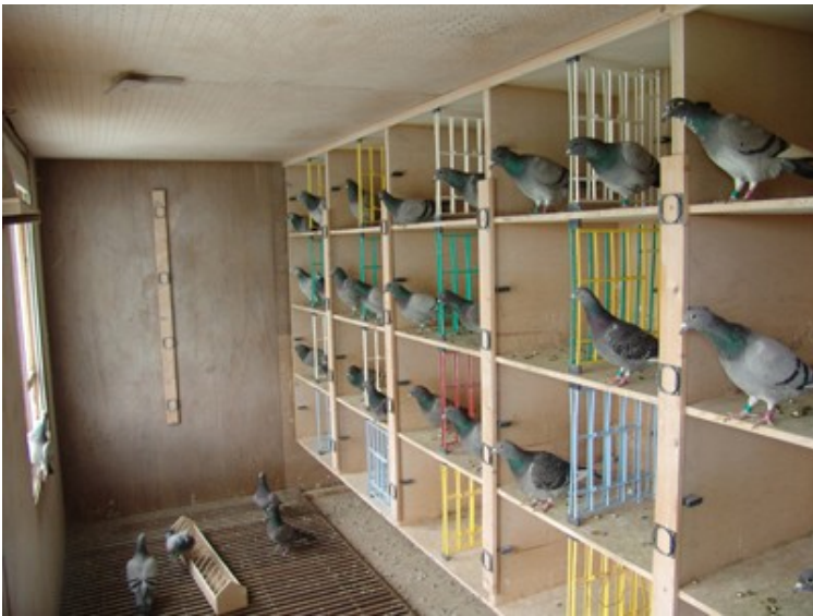
Wnętrze gołębnika młodych