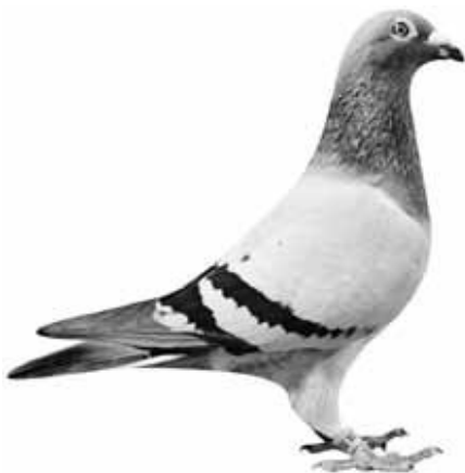
"Darling" B-02-3185274. 1 z Bourges'04 na 2.005 gołębi.