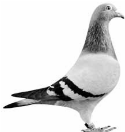
"Bourgeske" B-05-3176578. 1 z Bourges'06 na 683 gołębie.