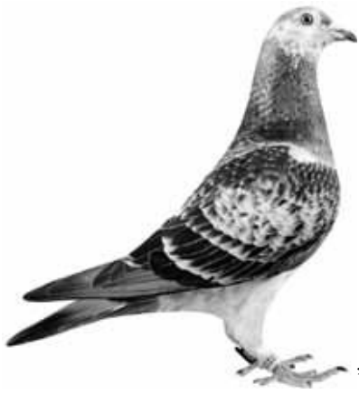
”Super Drijs” B-07-3129219. 3 prowincjonalny as KBDB w 2009r.