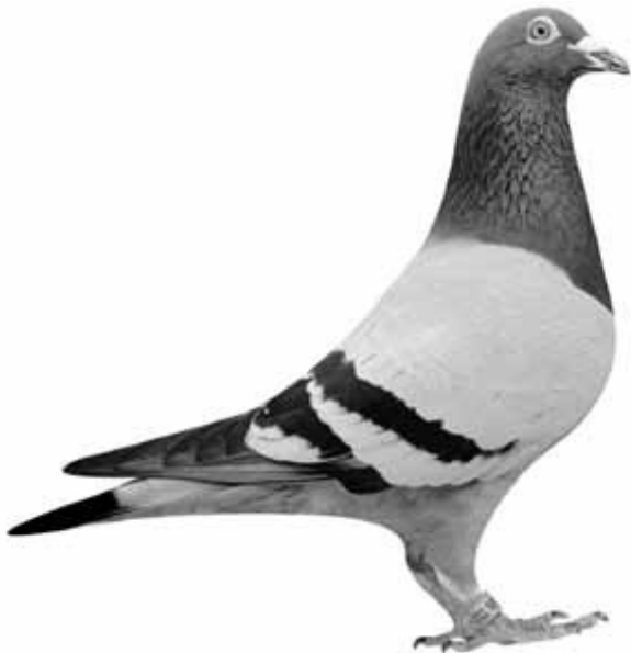
"G.P.S. Bliksem" B-05-3224565. Syn „Bliksem „ x