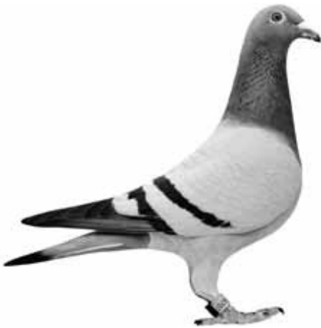
”Aske 2007” B-07-3124707. 1 z Bourges’09 na 595 gołębi. 1 prowincjonalny as KBDB w 2007r.