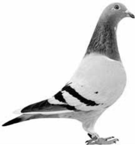
„Petrouchka” B-09-3040145. 1 z Argenton’09 na 2.631 gołębi.