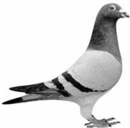
"Jef" B-05-3176583. 1 z Tours'06 na 2.501 gołębi.