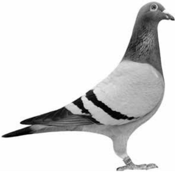
"Iris" B-05-3006881, syn „Bliksem „ x „Frieda"