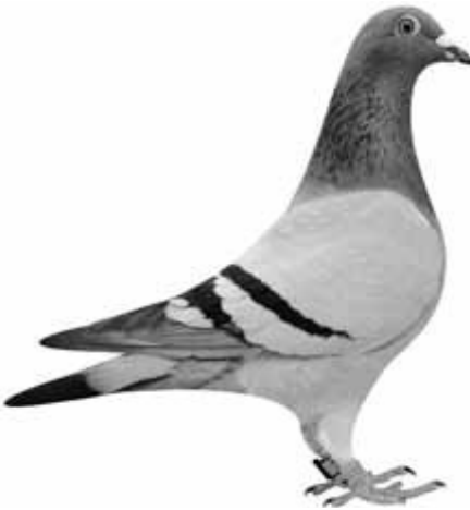
”Marieke” B-08-3037512. 1 z Gueret’08 na 2.241 gołębi. 1 prowincjonalny as KBDB w 2008r.