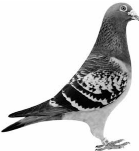
"Apollo" B-04-3230980. Syn „Bloksem" x „Wenus".